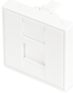
45x45 mm 1-Port Shutter