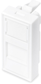
22.5x45mm 1-Port Shutter

Keystone Shutter 1 port versiyonu mevcuttur. Shutter, korumalı ve korumasız Kategori 5e, 6 & 6A sonlandırmaları sağlayan tüm REÇBER Keystone Jaklarını destekleyecektir. Sabitleme klipsleri, shutter'ın dik yönünü korurken yatay veya dikey olarak monte edilmiş kanalın takılmasına izin vermek için shutter'ın arkasına yerleştirilmiştir.